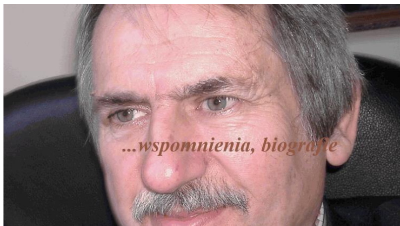
Selfie (2014)