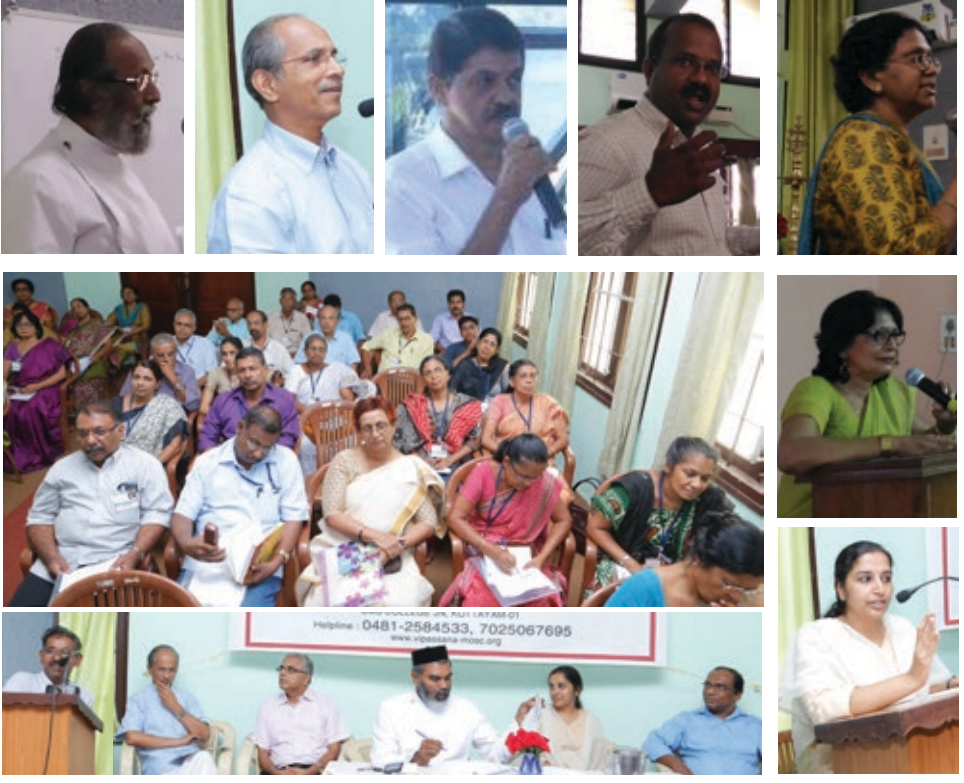
ക്രൈസിസ് കൗൺസിലിങ്ങ് ശില്പശാലയുടെ ചിത്രശേഖരം.

കോട്ടയം, ഇടുക്കി, നിരണം, തുമ്പമൺ, മാവേലിക്കര, കണ്ടനാട് വെസ്റ്റ്, തിരുവനന്തപുരം, റാന്നി-നിലയ്ക്കൽ, കൊച്ചി, അടൂർ-കൂടമ്പനാട്, ചെങ്ങന്നൂർ, എന്നീ ഭദ്രാസനങ്ങളിൽ നിന്നുള്ള മർത്തമറിയം വനിതാസമാജം പ്രതിനിധികൾ ഉൾപ്പെടെ അറുപത്തിയഞ്ചോളം ആളുകൾ പങ്കെടുത്തു.