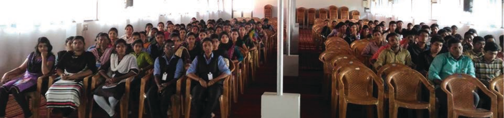
പാമ്പാടി കെ.ജി. കോളേജിൽ എം.ജി.ഒ.സി.എസ്.എം. യൂണിറ്റും വിവാസ്തനയും സംയുക്തമായി സംഘടിപ്പിച്ച ബോധവൽക്കരണ ക്ലാസ്സ്