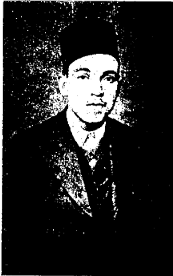
مندوب صحيفة البصائر

هـ - اعتبار وعد بلفور باطلاً من أساسه خوفاً - يستنكر المؤتمر موقف اميركا